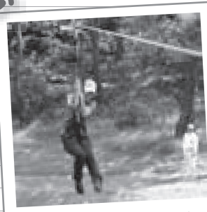
② 草津フォレストステージ 童心に帰って森の中のアトラクションを楽しもう！