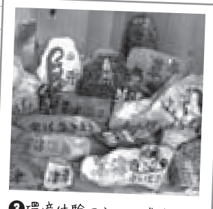
③ 環境体験ミュージアム 酸性河川の中和事業を分かりやすく紹介する見学施設！

環境体験ミュージアムでは百年石制作体験ができます。中和事業で使っている石灰石を使って、世界に1つしかない、あなただけの作品を制作してみましょう。※制作体験は無料（別途送料）