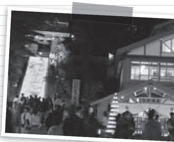
▲キャンドルイベント“夢の灯り”

避暑地としても有名な草津は、真夏でも平均気温が20度前後と過ごしやすい土地です。冬は雪景色に染まる草津高原も、夏は青々とした緑が広がります。温泉はもちろん、涼しい気候は体を動かすのにも最適！スポーツやアウトドアなどレジャー施設も多数あるので、ご家族や友人同士で爽やかな汗を流し、草津ならではの楽しい夏の思い出を作ってみませんか？