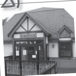
② ムレルツ記念館 草津の恩人と称えられるムレルツ博士の足跡をたどります。