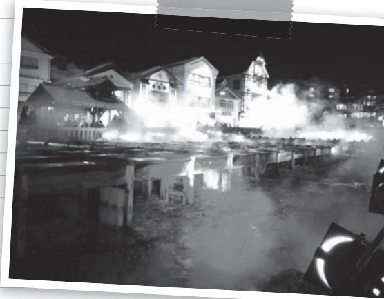
▲湯畑 特別ライトアップ

旅の初めはもちろん、途中でも、一度立ち寄ってみて豆知識を加えて、草津温泉の旅を更に楽しんでみてはいかがでしょうか。