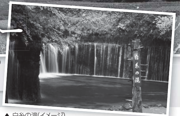
▲ 白糸の滝(イメージ)