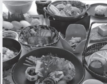
京会席 京都府の現代の名工

平成26年度に「京都府の現代の名工」を受賞した総料理長が自信をもってご用意する、京料理などのご夕食と朝食をセットにした1泊2食のおすすめプランです。