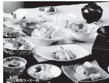
夕食専用コース一例