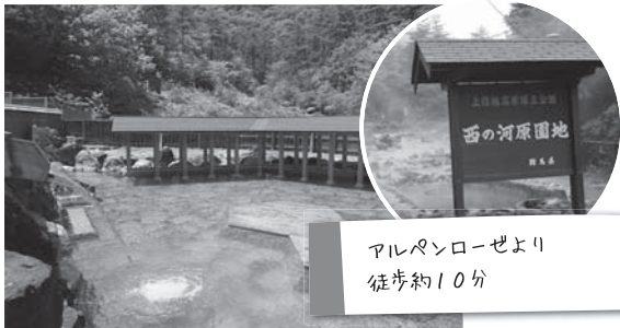
アルペンローゼより 徒歩約10分

西の河原露天風呂は、男湯・女湯を合わせると500㎡もある日本でも有数の広さを誇る露天風呂です。周りは森林に覆われ、新緑や紅葉、雪見とその時々季節を感じながら草津の温泉を堪能できます。夜はライトアップされており、入浴可能。空には満天の星、どこからか聞こえる虫の声に耳を傾けながら湯に浸かり、日頃の疲れを癒してください。