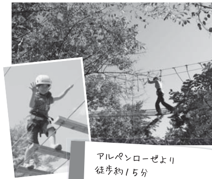
アルペンローゼより 徒歩約15分

全長約640m、最高点10m超。約5,000㎡の広々とした敷地に、フランスの山岳救助トレーニングから生まれたアトラクションが42もあるアミューズメント施設です。池を越えたり、木々や丸太を渡ったり、100m級のジップラインで宙を飛んだり、大人も子どもも一緒に遊べ、しかも全身を使ってしっかり運動ができます。