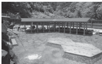
利用助成券が使えます

西の河原露天風呂は、男湯と女湯を合わせると500㎡もあり、日本有数の広さを誇ります。源泉は、高温で強酸性の「万代源泉」。開放感と自然の懐に抱かれる安らぎに身をゆだねてください。