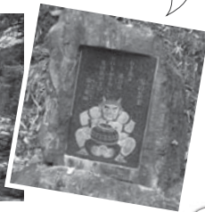
園内にある鬼の茶釜碑を探してみよう！