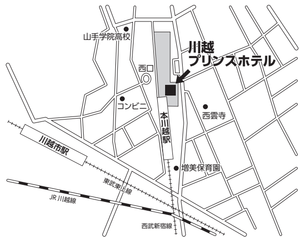
川越プリンスホテル (第2区選挙会場)