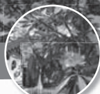
アスマシャフナゲ

※日曜日～木曜日の宿泊 (但し、5/3、5/4、5/30～6/2、6/9の宿泊を除く)