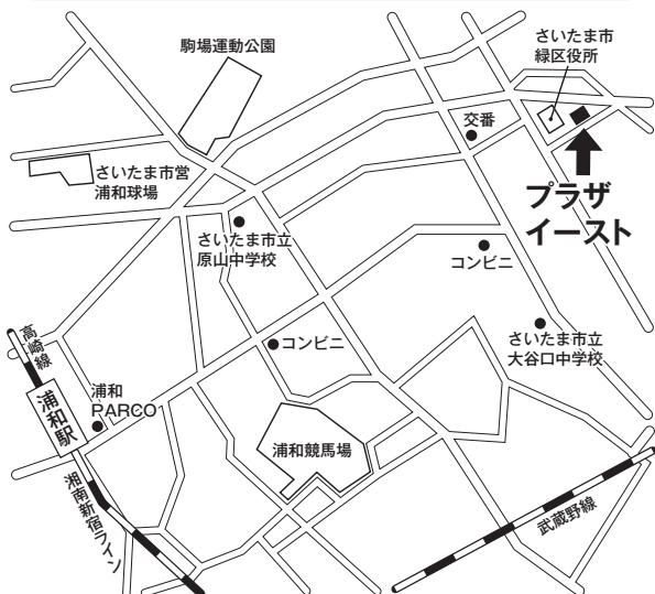
プラザイースト(さいたま市) (第1区選挙会場)