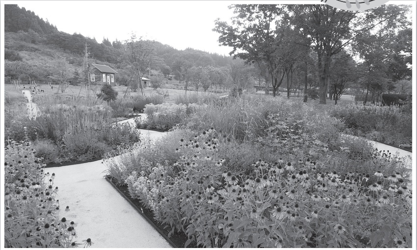
中之条ガーデンズ「ナチュラルガーデン」

※新型コロナウイルスの感染状況により、行程の変更または中止とさせていただきます。