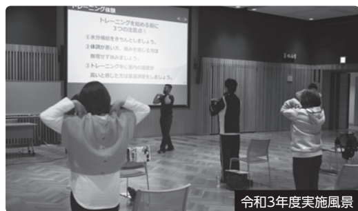
令和3年度実施風景

※本セミナーは、「特定保健指導対象者の方」と「一般の方」合同で行います。当日、特定保健指導対象者であることが特定されないよう配慮して実施いたします。