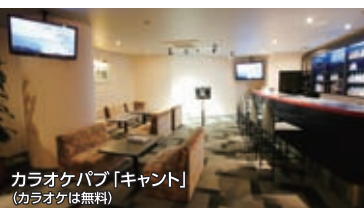
カラオケパブ「キャント」 (カラオケは無料)