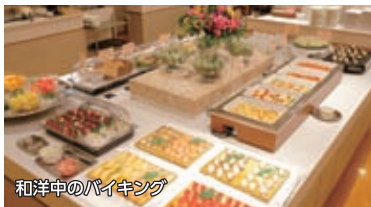
和洋中のバイキング