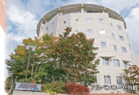
アルペンローゼ外観