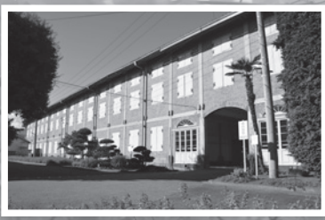
▲ 斜めから見た東繭倉庫