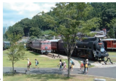
碓氷峠鉄道文化むら