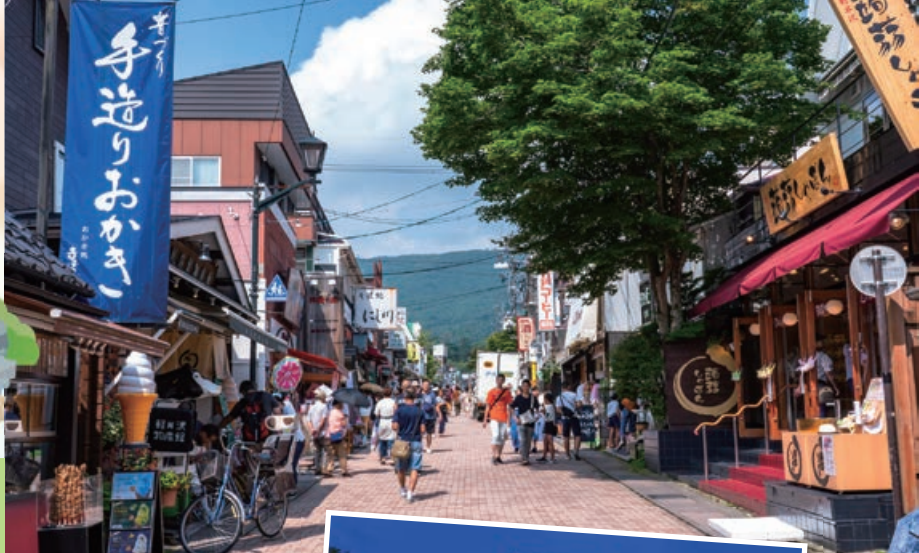
※画像はイメージです。